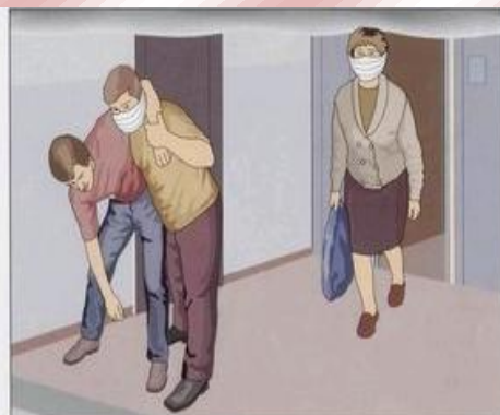
Эвакуировать людей из помещений

В первую очередь эвакуацию следует проводить используя лестничные клетки, ведущие наружу здания, а также переходы по балконам в нижние этажи и в соседние секции дома. В задымлённом помещении двигаться к выходу надо пригнувшись или ползком, при возможности накрыв голову плотной тканью.