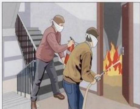
Использовать первичные средства пожаротушения

Для защиты от дыма следует применять только изолирующие противогазы или фильтрующие, но с голкалитовыми патронами, а также самоспасатели изолирующие. Как исключение на короткое время можно использовать влажные повязки.