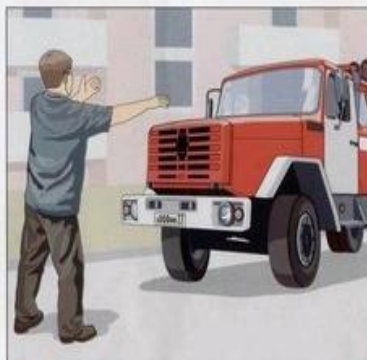
Встретить пожарные подразделения