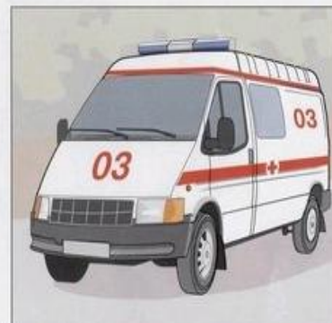
При наличии пострадавших вызвать "скорую медицинскую помощь"

Информация подготовлена с помощью СПС КонсультантПЛЮС