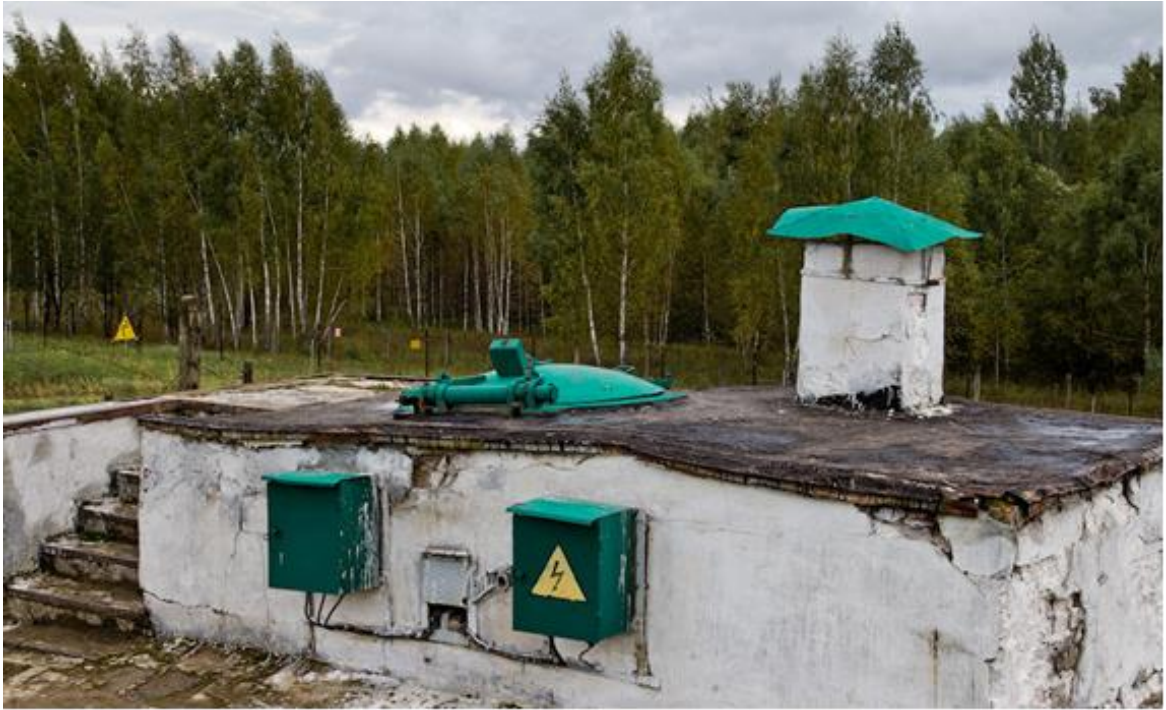
Спуск в «шахту» .

Только выскочили в оголовок и «Пышь». Из машины вызвали КП и в выражениях не стеснялись. Минут через пять прибежал начальник старта - майор, весь расстроенный, повторял: «Ребята, что хотите, не докладывайте, а с лейтенанта я шкуру сниму, флягу спирта хотите?». Спирта мы не хотели, у самих в машине 20 литровая канистра для протирания контактов всегда была, но это уж другая тема про спирт, если в чем и не было недостатка в ракетных войсках, так это в спирте.