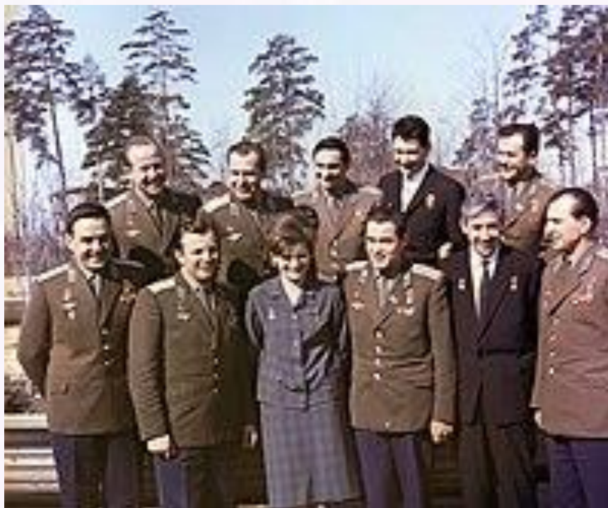
Служба в отряде космонавтов