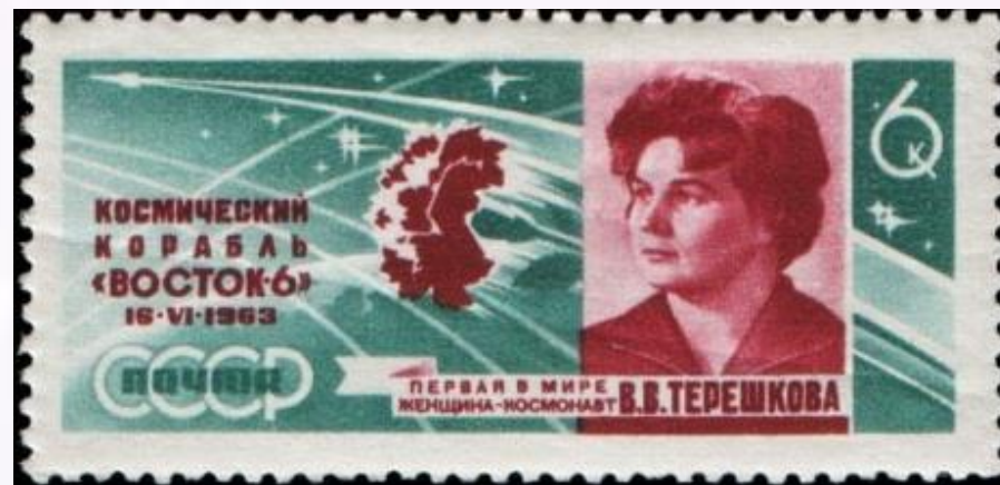
Почтовая марка СССР, 1963 год