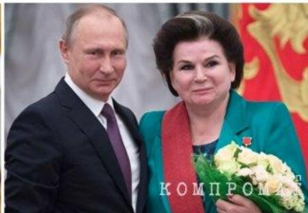
Терешкова с Хрущевым, Брежневым, Ельциным и Путиным.