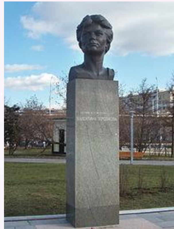
Памятник Валентине Терешковой на аллее Космонавтов в Москве