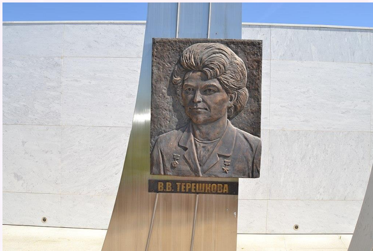
Портрет В. В. Терешковой, Парк покорителей космоса им. Юрия Гагарина.