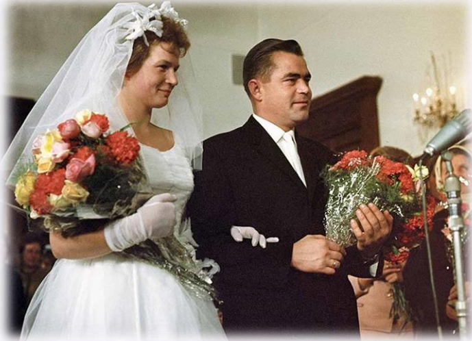
Свадьба Валентины Терешковой и Андряна Николаева. 3 ноября 1963 года