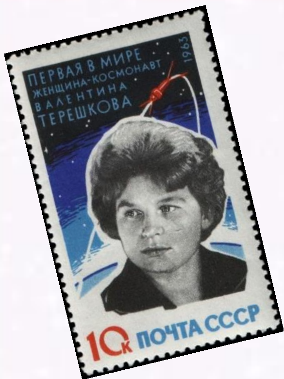
Почтовая марка СССР работы Лесегри, 1963 год