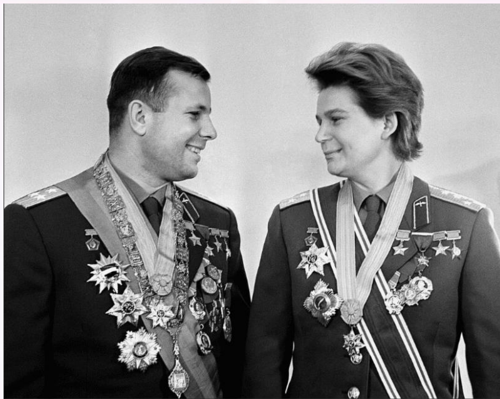
В.В. Терешкова с Ю.А. Гагарином