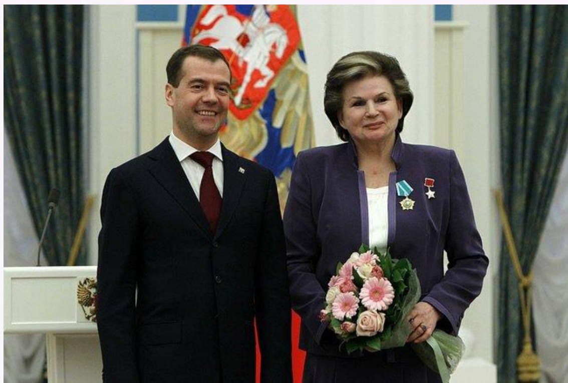
Дмитрий Медведев награждает Валентину Терешкову Орденом Дружбы. 12 апреля 2011 года